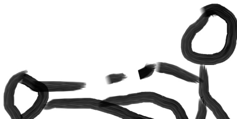
Die Schildkröte von Philipp

Ich und meine Klasse 4b gehen immer freitags im Heidberg Bad schwimmen. Ich bin vom 3er gesprungen. Ich musste Ringe holen. 12 Stück, wenn ich ehrlich sein soll. Dann dürfen wir immer 15 Minuten spielen. Ich spiele immer wer am längsten unter Wasser bleiben kann. Ich bin immer traurig. Ich bin in der Klasse der Beste. Danach damm... damm.... damm... daaaaaaaaaammmmmmmmmmmmmm.00