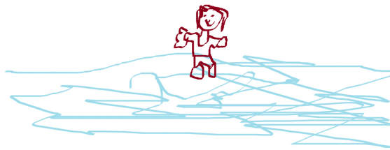
Das Freibad von Lara

Die Zeitung von SchülerInnen für SchülerInnen Ausgabe 9 vom 11. Juni 2015